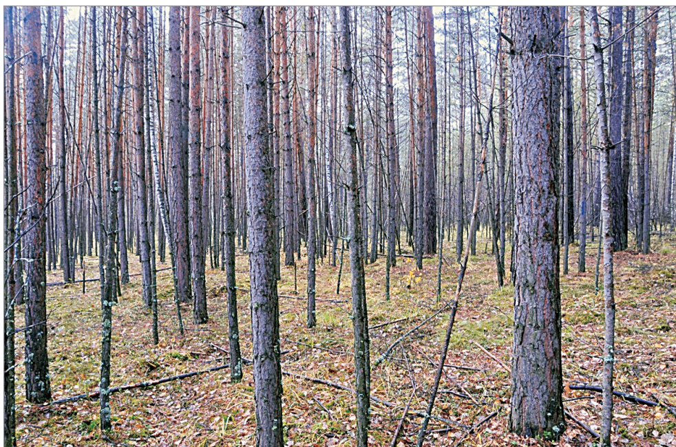
Рис. 2. Общий вид пробной площади № 11 в Чуноярском лесничестве Красноярского края.

Термины и показатели, приведенные в табл. 1–3: