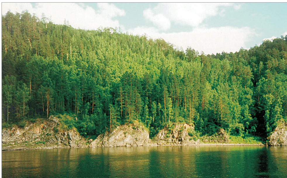
Рис. 1. Водоохранные сосновые леса в бассейне р. Ангара (Богучанский район Красноярского края).